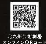
北九州芸術劇場 オンラインQRコード

取扱窓口 ・北九州芸術劇場 プレイガイド(10:00～19:00) ・北九州市立響ホール(9:00～18:00) 店頭販売のみ ・北九州芸術劇場 オンラインチケット(北九州芸術劇場HP、北九州芸術文化振興財団 音楽事業課HP) ・北九州芸術劇場 電話093-562-8435(10:00～17:00 土・日・祝を除く) ・チケットぴあ 0570-02-9999 Pコード:【モノレール公演】280-241 / 【響ホール公演】280-242 ・ローソンチケット 0570-084-008 Lコード:【モノレール公演】84215 / 【響ホール公演】84216