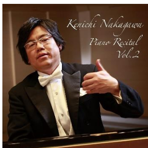
♪中川賢一 ピアノリサイタル Vol.2 (T&K エンタテインメント/2017)