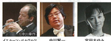
イェルーン・ベルワルツ 中川賢一 宮田まゆみ

イェルーン・ベルワルツ トランペット・ミニリサイタル: イェール:即興曲 (イェルーン・ベルワルツ/トランペット、中川賢一/ピアノ) 伝ブラームス:トランペットまたはホルンのための12のエチュード集より (イェルーン・ベルワルツ/トランペット) 坂田直樹、リナ・トニア、木下正道、細川俊夫:新作エチュード集 (イェルーン・ベルワルツ/トランペット) [世界初演] 藤井喬梓:根つき (松村多嘉代/ハーブ) クラウド・フーパー:黒い嘆き (宮田まゆみ/笙、葛西友子/パーカッション)