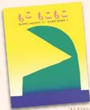
「もこもこもこ」 作:宮川 博太郎 絵:長谷川 定吉 出版社:文研出版

主催:公益財団法人北九州市芸術文化振興財団 共催:北九州市 後援:北九州市教育委員会、北九州音楽協会 助成:文化庁文化芸術振興費補助金(劇場・音楽堂等機能強化推進事業)|独立行政法人日本芸術文化振興会