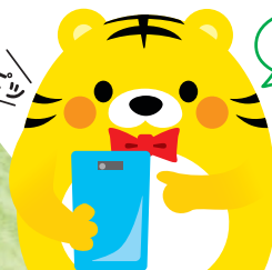
オーケストラちゃん