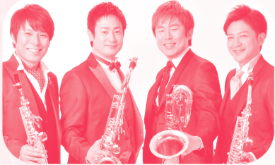
クワチュール・ベー 〔サクソフォーン四重奏〕 Quatuor B, saxophone quartet

東京藝術大学卒業。同大学大学院、および二期会オペラスタジオ修了後、イタリア政府給費生としてミラノへ留学。イタリア・オルヴィエト国際コンクール第2位。マンチネリ劇場「ファルスタッフ」ナンネッタ、佐渡裕指揮・宮本亜門演出「キャンディード」クネゴンテ、二期会「コジ・ファン・トゥッテ」(06年度文化庁芸術祭大賞)デスビーナ、「ホフマン物語」オランピア、新国立劇場「魔笛」パバゲーナ、日生劇場「ヘンゼルとグレーテル」グレーテル等を演じ、卓越した歌唱と演技力で好評を博す。テレビ朝日「題名のない音楽会21」、BSプレミアム「クラシック倶楽部」、NHK-Eテレ「シャキーン」等メディアにも数多く出演。また、ソニー音楽財団<Concert for KIDS>を始め、全国各地におけるアウトリーチや教育プログラムにも積極的に取り組み、幅広く活躍している。“MOZART SINGERS JAPAN” CD「コジ・ファン・トゥッテ」リリース。桐朋学園芸術短期大学、桐朋学園大学、洗足学園音楽大学非常勤講師。二期会会員。