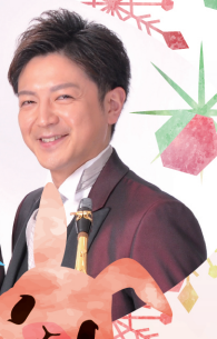
クワチュール・ベ