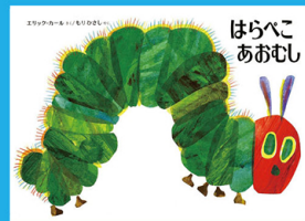
「はらべこあおむし」 作:エリック・カール 訳:もりひさし 偕成社