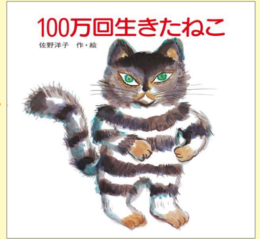
『100万回生きたねこ』 作・絵：佐野洋子（講談社 刊）