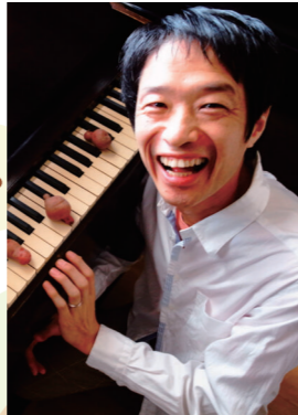
野村 誠 【作曲家・鍵盤ハーモニカ奏者】

作曲家、ピアニスト、鍵盤ハーモニカ奏者。様々な音楽ジャンルを越境し、美術、舞台、文学、じゃれ、相撲、建築、教育、福祉、飼育、環境など異ジャンルとコラボレーションを積極的に行う。日本センチュリー交響楽団コミュニティプログラムディレクター。千住じゃれ音楽祭ディレクター。日本相撲協会芸術作家協議会理事。第1回アサヒビール芸術賞などを受賞。